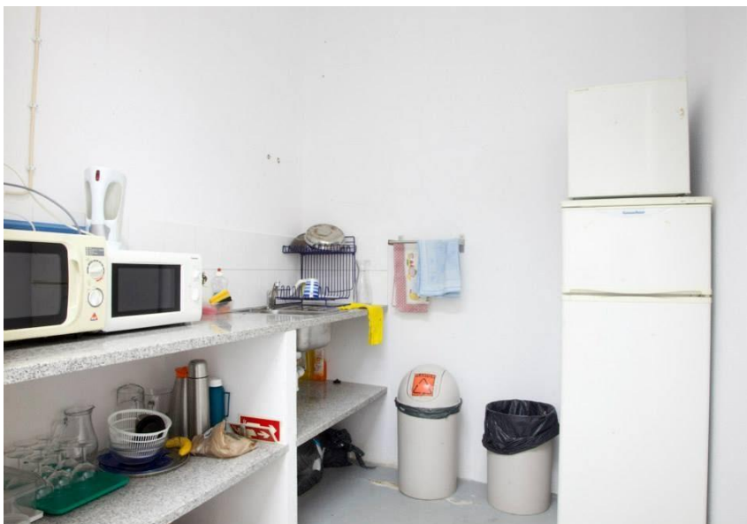
Fotografias 2 e 3 – Espaço para refeições

O Programa de Residências - O Rumo do Fumo tem o apoio da Câmara Municipal de Lisboa, Divisão de Acção Cultural / Direcção Municipal de Cultura.