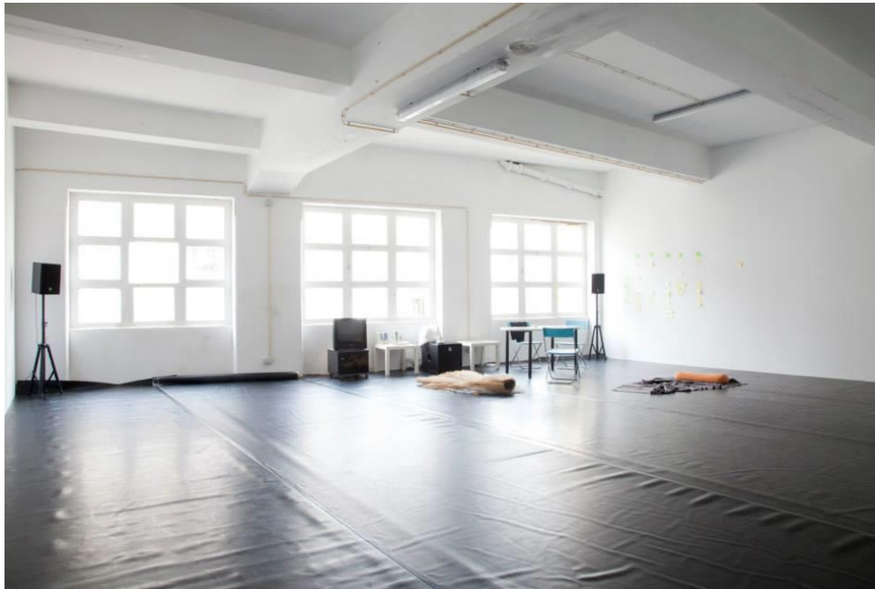
Fotografia 1 - Estúdio