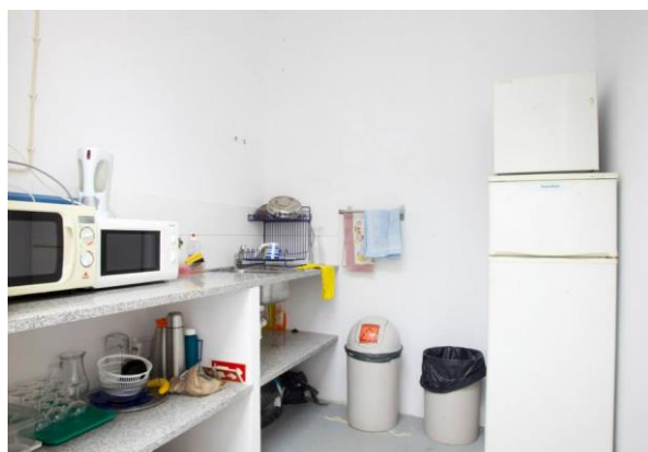
Fotografias 2 e 3 – Espaço para refeições

O Programa de Residências - O Rumo do Fumo tem o apoio da Câmara Municipal de Lisboa, Divisão de Acção Cultural / Direcção Municipal de Cultura.