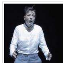
Orgueil Luciférien : it's going to get worse and worse...