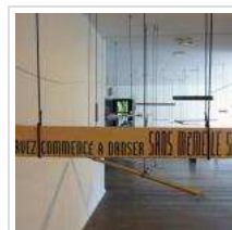
Danses exposées au petit musée de la danse du 14 mai au