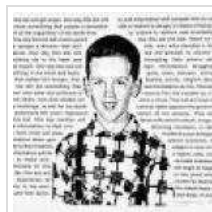
Au bord du gouffre de David Wojnarowicz par